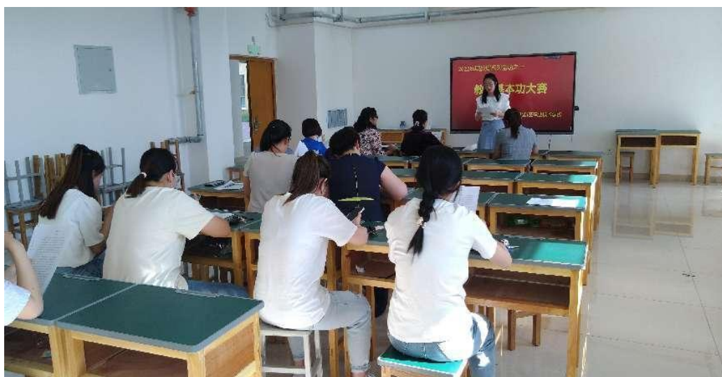
图 15 学校开展教师基本功大赛图

（四）以赛促教，强师赋能。 比赛是最好的验收时机、展示机会，学校开展了教师基本功大赛，并派出教师参加教育主管部门举办教学技能大赛，和高手过招，磨练技能，审视优势和不足，有效的提高教育教学水平。