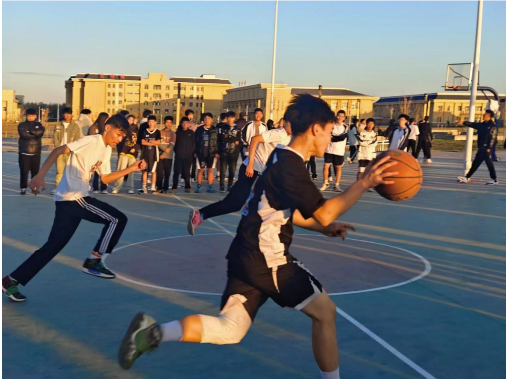
图 6 学校篮球社