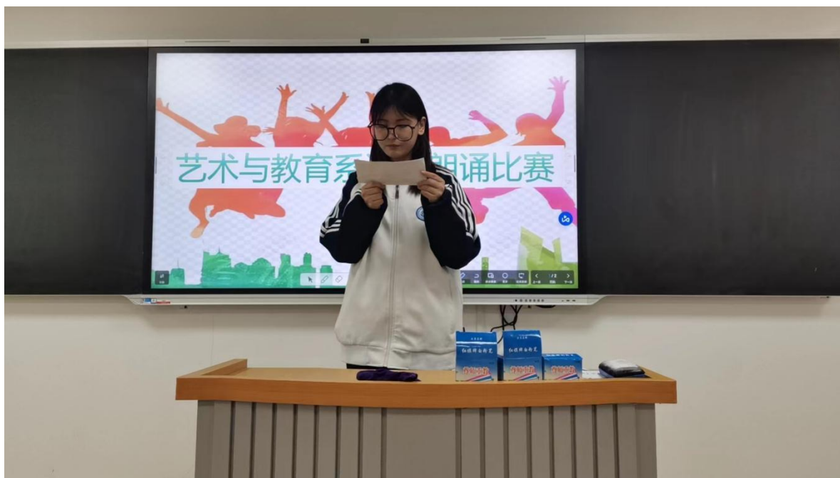
图 13 播音主持专业学生参加朗诵比赛

(4) 模拟教学，将教学放在真实的场景中，理论与实践相结合，增强对专业技术的认识，增加体验感，提高学生的自信心和成就感，从而激发专业认同感和敬业精神。