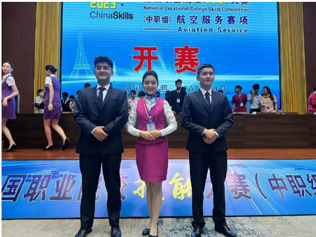
图 14 航空服务专业学生参加国赛