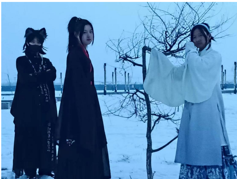
图 10 学校汉服社汉服展