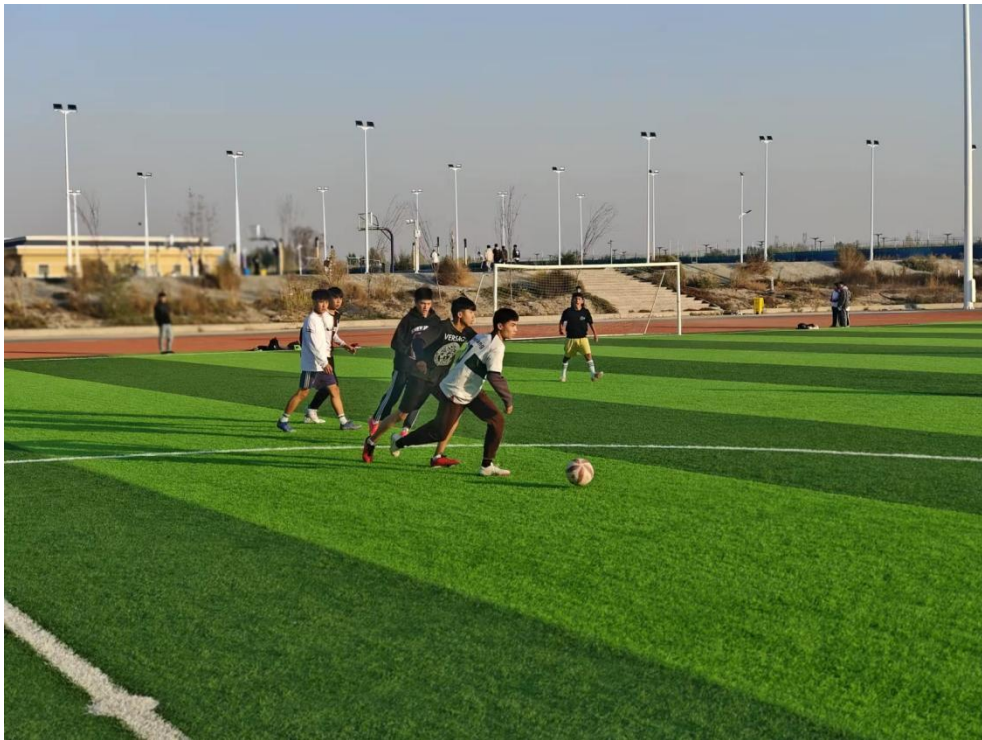
图 7 学校足球社