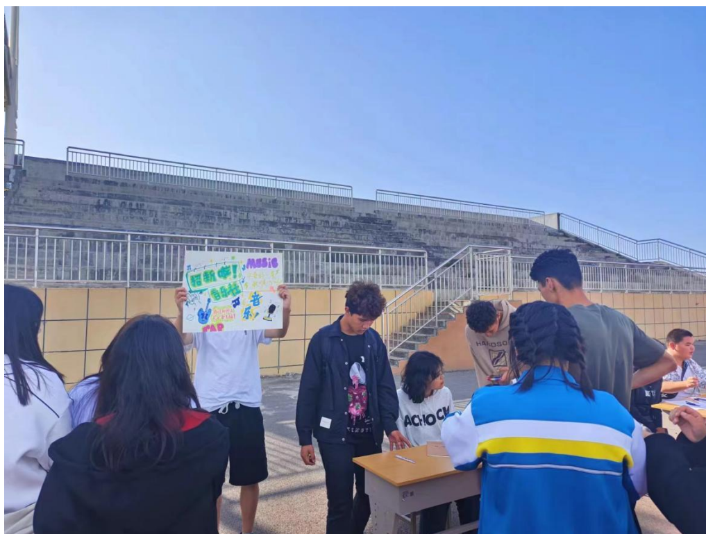
图 9 田径社比赛检录中