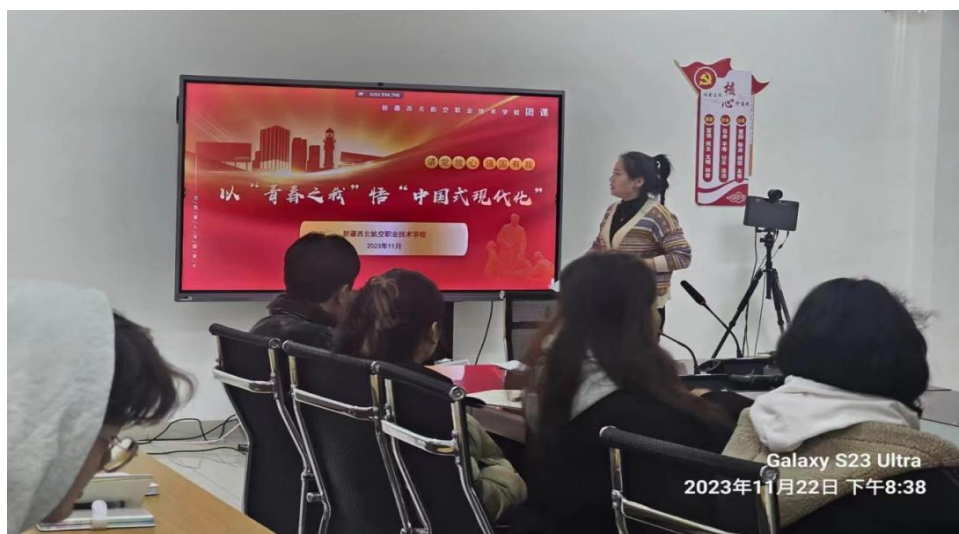
图4 入团积极分子进行“以青春之我”主题团课