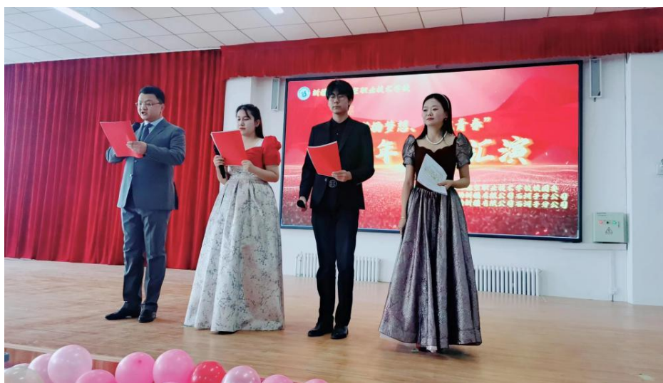
图5 2023-2024 学年社团活动汇报演出

丰富社团活动。加强团组织和学生会建设，积极开展学生社团活动，礼仪社、书画社、手工社、舞蹈社、篮球社、足球社、读书社等学生社团，社团活动正常开展。2023年12月同时，举行社团迎新春文艺汇演，各社团展现出自己社团的特色。