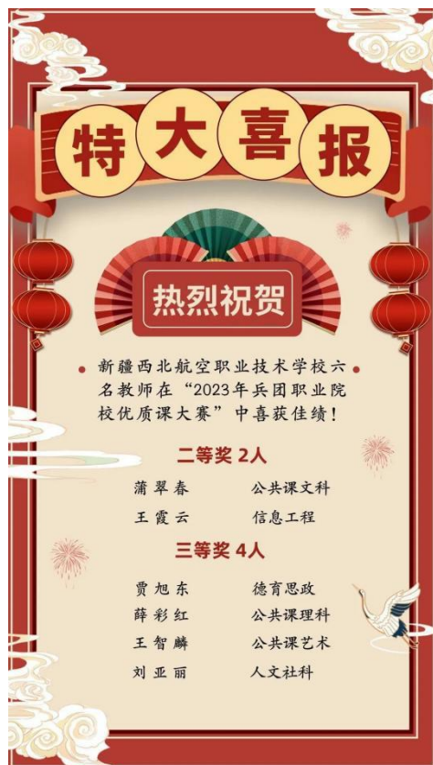
图 16 兵团优质课大赛获奖名单

我校蒲翠春、王霞云老师在 2023 年兵团职业院校优质课大赛获得二等奖，贾旭东、薛彩虹、王智麟获得三等奖；张荣庆、蒲翠春、李春逢三位教师在职称评定中晋升为中级职称；全体教职工平均收入水平从上半年的 4000 元左右上升为 5500 元左右。