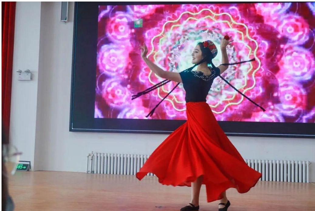
图 8 学校舞蹈社表演节目