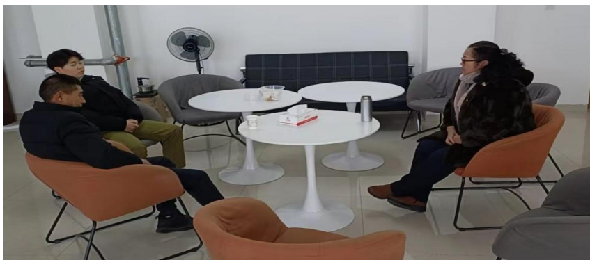
图2 新疆西北航空职业技术学校满意度调查

学校遵循“先成人、后成才”的育人理念，狠抓学生品德、职业道德和行为习惯养成教育，狠抓学生的专业技能训练，呈现出了“明理自强、厚德笃学”的良好校风。学校组织开展内容丰富、形式新颖、吸引力强的思想道德、第二课堂、文娱、体育类等校园文化活动，学校成立了校园安全领导小组，构建安全管理网络，形成了一级抓一级，一级对一级负责的工作格局。学校各部门通过问卷等形式对在校学生进行调查：91%以上的学生对理论学习、专业学习方面感觉满意或基本满意，94%以上的学生对校园文化与社团活动方面感觉满意或基本满意，95%以上的学生对在校学习生活、学校安全方面感觉满意或基本满意。