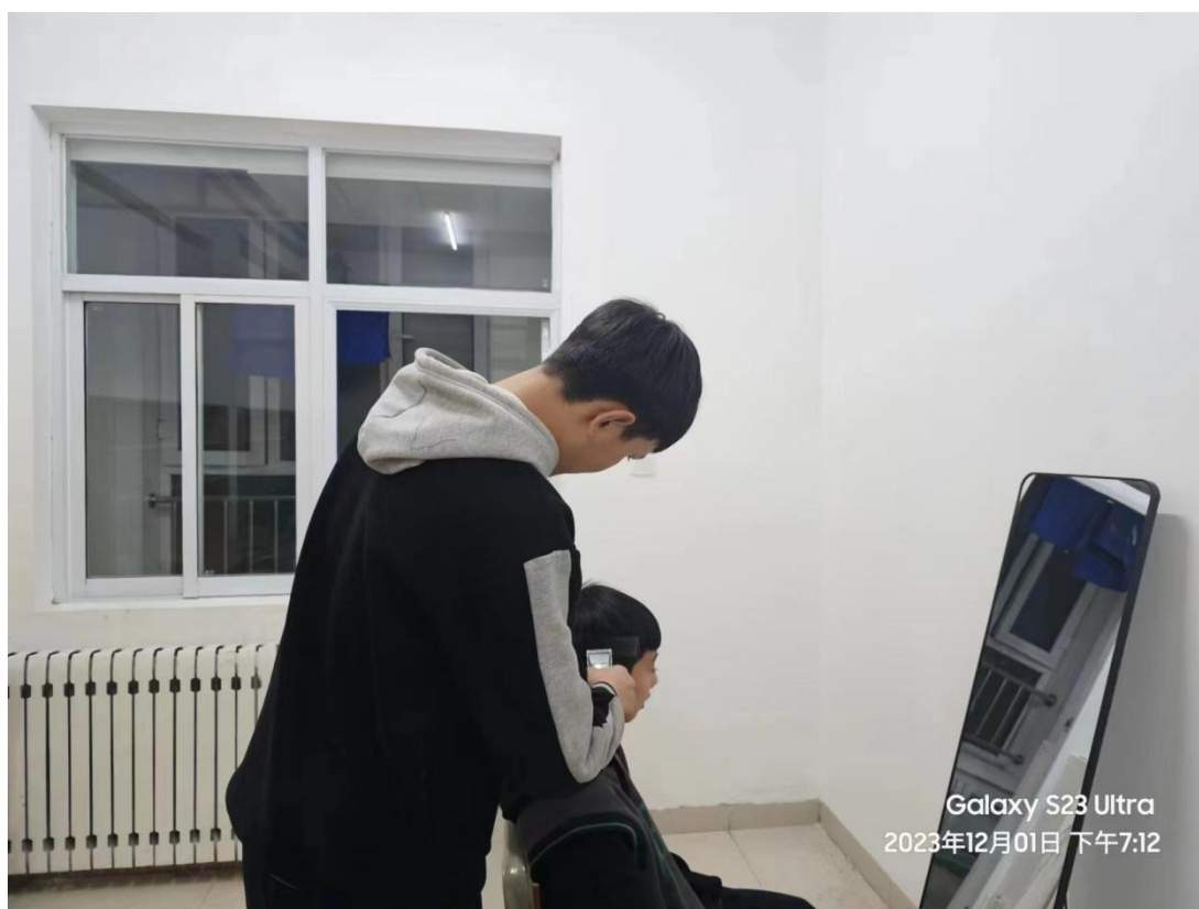
图 11 美容美发社团成员正在给同学理发